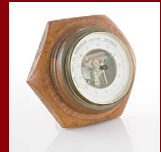
| Coaching |