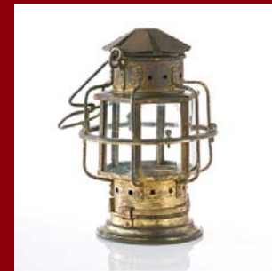
| Beratung |