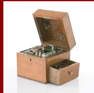
| Training |